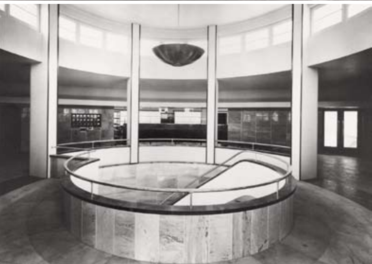
Vistas do exterior e interior da estação do correio do Estoril, projectada pelo arq. Adelino Nunes. [Década de 1940]