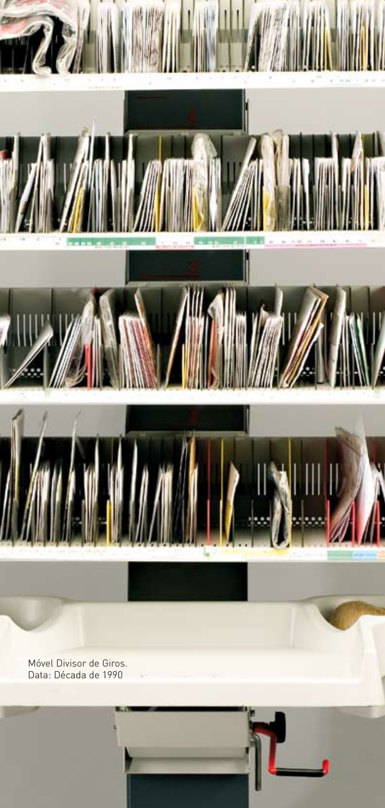
Móvel Divisor de Giros. Data: Década de 1990