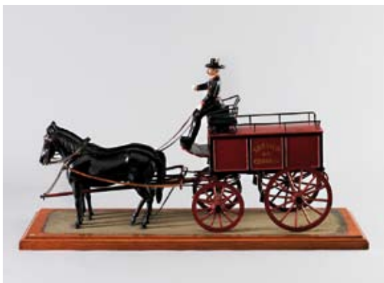
Carro de tracção animal de transporte urbano de correio. Data: 1ª metade do Séc. XIX

Por outro lado, o diploma criou também as caixas postais públicas, que deram origem aos marcos de correio. Por dificuldades variadas, nomeadamente por não estar feita a identificação de todas as ruas e o cadastro das residências, a distribuição domiciliária para os lisboetas só começou a funcionar em 1821.