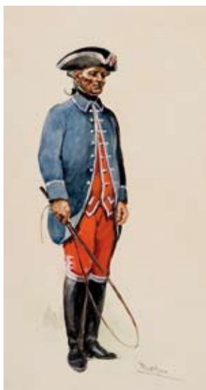
Aquarela de Cocheiro da Mala-Posta - 1798, da Autoria de Alberto de Sousa. Data: Década de 1940