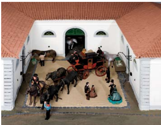
Maqueta da Estação de Muda de Casal dos Carreiros (1856), da autoria de Raúl Campos, reconstituindo o ambiente que se vivia naquela lugar, no momento da partida da diligência. Data: 1954